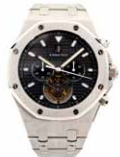
LOT 82 • AUDEMARS PIGUET Adjugée 52 000€