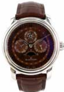
LOT 22 • BLANCPAIN Adjugée 15 200€