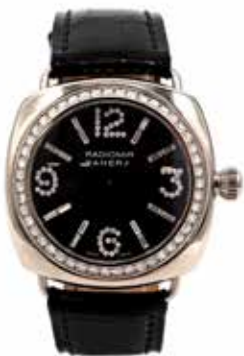
LOT 49 • RADIOMIR PANERAI Adjugée 10 000€