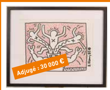
Post-Wars & Contemporary art

Nos départements ci-dessous représentent un marché local et international :