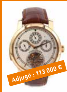
Joallerie et montres de collection