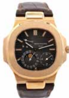
LOT 75 • PATEK PHILIPPE Adjugée 45 000€