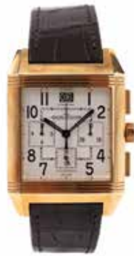
LOT 57 • JAEGER LECOULTRE Adjugée 9 000€