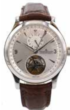
LOT 62 • JAEGER LECOULTRE Adjugée 16 000€