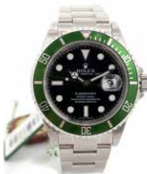
LOT 95 • ROLEX