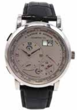
LOT 67 • A. LANGE & SOHNE Adjugée 22 000€