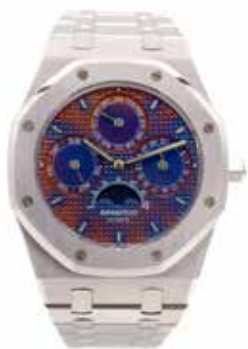
LOT 90 • AUDEMARS PIGUET