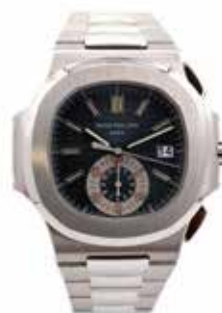
LOT 77 • PATEK PHILIPPE Adjugée 53 000€