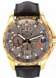
LOT 33 • CHOPARD Adjugée 5 300€