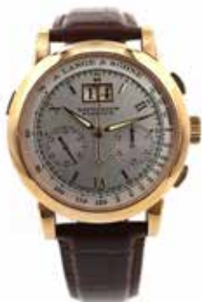
LOT 69 • A. LANGE & SÖHNE Adjugée 31 500€