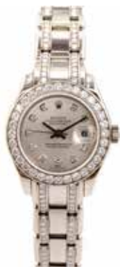
LOT 94 • ROLEX