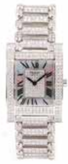
LOT 36 • CHOPARD Adjugée 12 400€