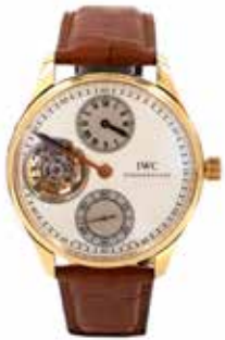
LOT 13 • IWC Adjugée 23 000€