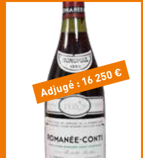
Grands vins & spiritueux