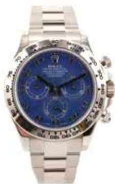
LOT 97 • ROLEX