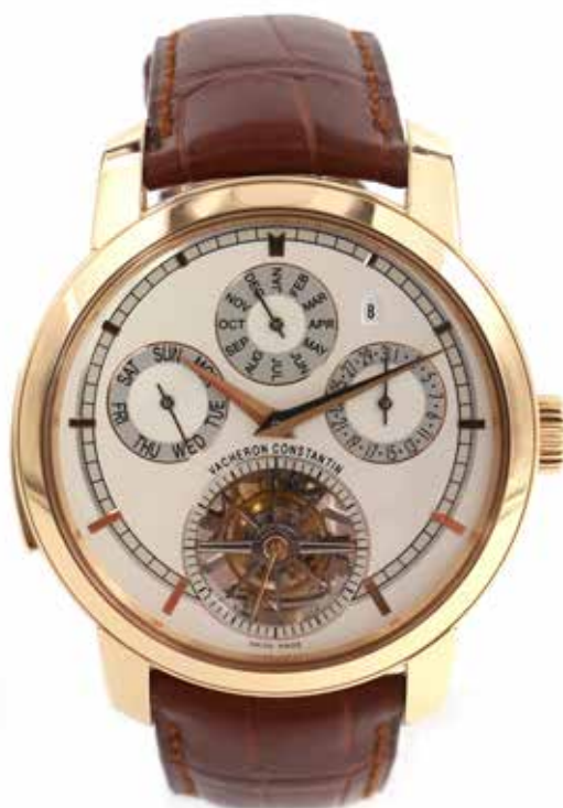
LOT 133 • VACHERON CONSTANTIN