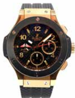
LOT 118 • HUBLLOT