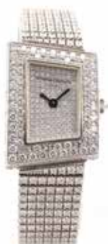
LOT 136 • VACHERON CONSTANTIN