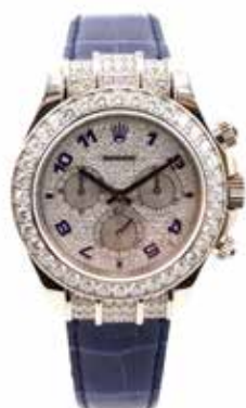
LOT 112 • ROLEX